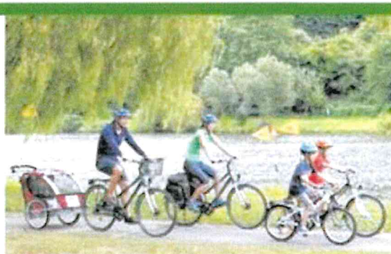
Profitez de la verdure de ce pays à vélo.