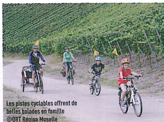
Les pistes cyclables offrent de belles balades en famille