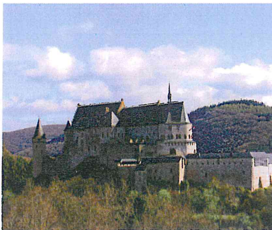
Le château de Vianden