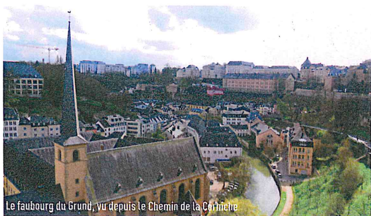
Le faubourg du Grund, vu depuis le Chemin de la Corniche