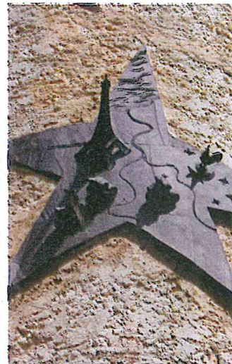
La France représentée sur les colonnes des Nations à Schengen