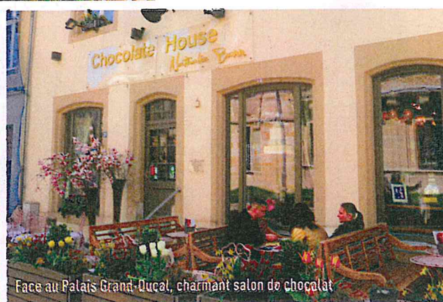
Face au Palais Grand-Ducal, charmant salon de chocolat

De la taille d'un département français, le Grand-Duché du Luxembourg est un confetti cosmopolite au milieu de l'Union Européenne. Minuscule par la taille, il offre pourtant une grande diversité de paysages, avec cinq régions très différentes : la capitale Luxembourg, la Moselle et ses vignobles, le Müllerthal baptisé "Petite Suisse luxembourgeoise", les Ardennes et leurs parcs naturels, et les Terres Rouges, pays des mines. Que de contrastes inattendus pour un si petit territoire, calé entre trois pays ! Entre mai et septembre, ses charmantes routes sinueuses et ses sentiers en font une destination idéale pour les amoureux de moto, de vélo ou de rando.