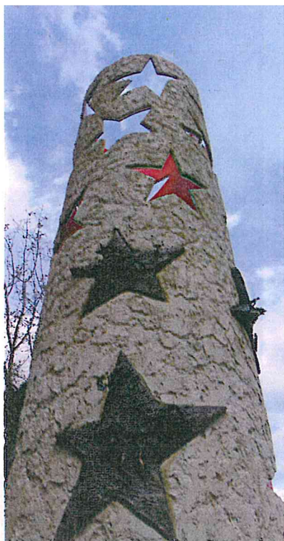
Les colonnes des Nations, face au Musée Européen de Schengen