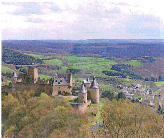
Le château de Bourscheid