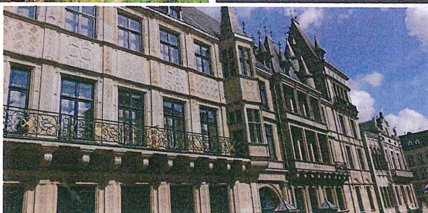
Le Palais Grand-Ducal