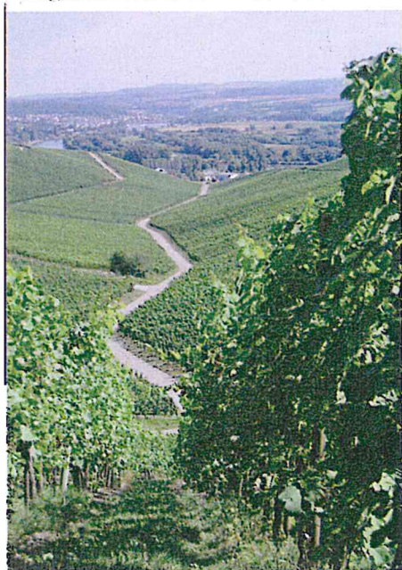
La vallée de la Moselle

Echternach, charmante capitale de cette Petite Suisse, est entourée de collines boisées, dans la basse vallée de la Sûre. Les ruelles du centre historique sont bordées de jolies maisons traditionnelles et sur la place du Marché se dresse l'ancien palais de justice avec ses arcades gothiques et ses échauguettes. La basilique Saint Willibrord est l'un des plus importants sanctuaires du pays, où les pèlerins se rendent en procession dansante le mardi suivant la Pentecôte. Echternach est une base idéale pour les amateurs de vélo ou de marche : 112 km de sentiers pédestres, labellisés "Leading Quality Trails - Best of Europe", bien fléchés et entretenus emmènent les randonneurs à la découverte de vues panoramiques, gorges encaissées ou sentiers le long des rivières et cascades. Certains passages sont parfois étroits (40 cm) entre les parois rocheuses.