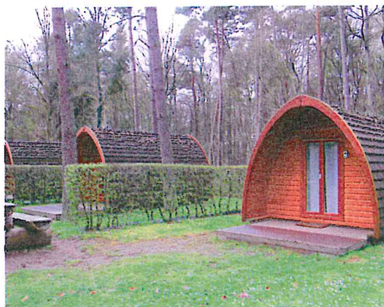
Expérience "glamping" dans ces chalets à Kautenbach