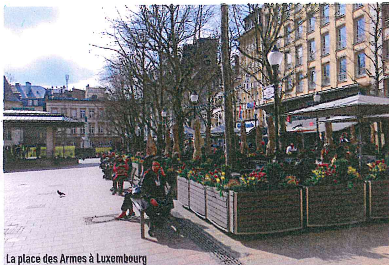
La place des Armes à Luxembourg