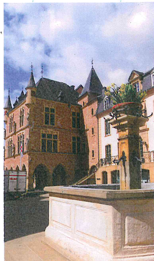
Place du marché à Echternach

Schengen est le point de départ de l'agréable route des vins qui longe la Moselle jusqu'à Wasserbilib. Dans ce paysage qui respire la quiétude et la prospérité, les coteaux en pente douce sont plantés de vignes qui donnent du Crémant du Luxembourg et des vins tranquilles issus de cépages riesling, pinot gris, pinot blanc, pinot noir, chardonnay, auxerrois ou gewürztraminer.