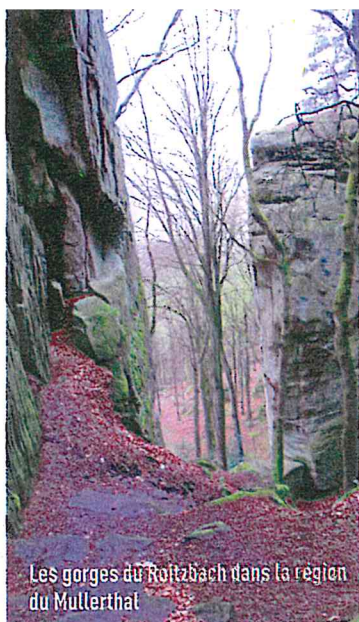
Les gorges du Roitzbach dans la région du Mullerthal