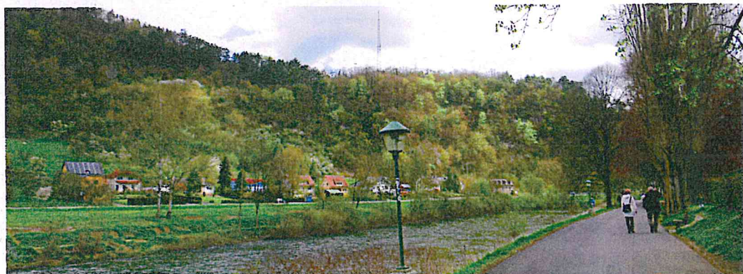
Le long de la Sûre à Echternach